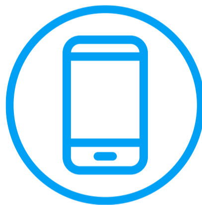
Focus camera on marker