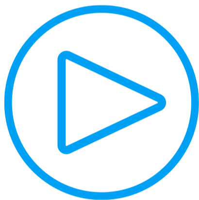
Start and update thyssenkrupp AR-App